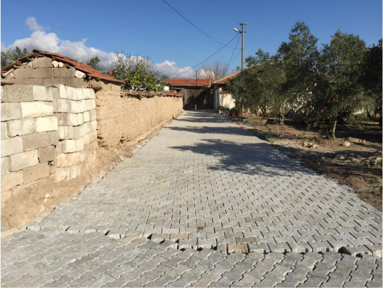
Kayışlar Mahallesi'nde Yapılan Taş Kaplama Çalışması