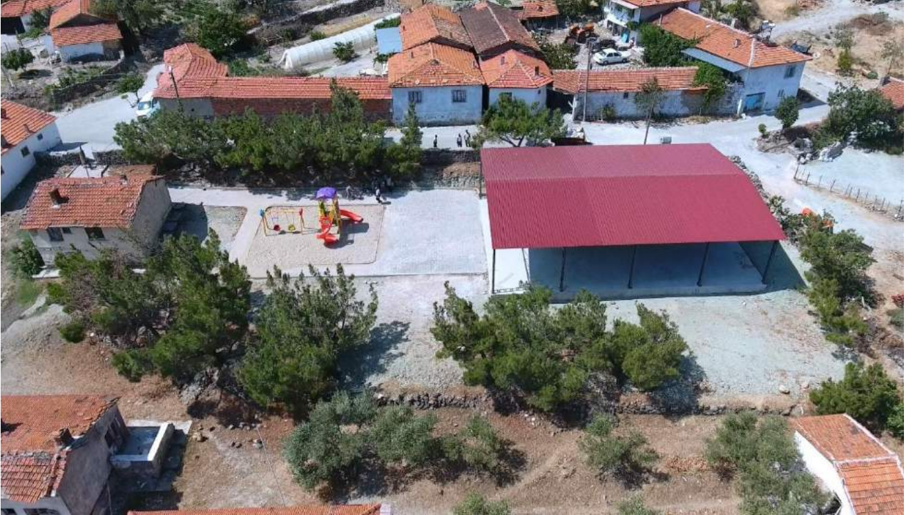
Şatırlar Mahallesi Çok Amaçlı Kapalı Alanının Çalışma Sonrasındaki Durumu

İlçemiz Şatırlar Mahallesi'nde bulunan alana vatandaşlarımızın düğün, cemiyet ve hayırlarını yapabilecekleri bir kapalı alan oluşturulup yanına çocuk oyun grupları yerleştirilerek halkımızın ve çocuklarımızın hizmetine sunulmuştur.