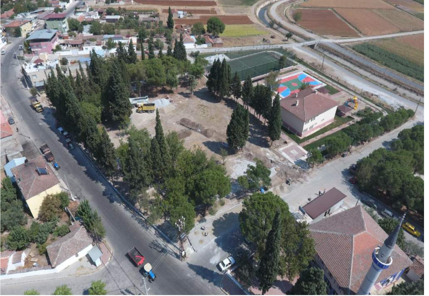
Nuriye Mahallesi Rekreasyon Alanı Çalışmalarına başlanması.