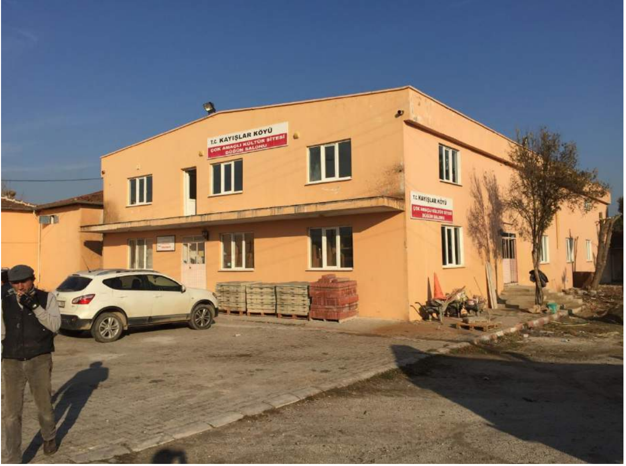
Kayışlar Mahallesi Çok Amaçlı Kültür Sitesi ve Düğün Salonunun Eski Hali

İlçemiz Kayışlar Mahallesi'nde bulunan Çok Amaçlı Kültür Sitesi ve Düğün Salonunun tadilatı gerçekleştirilmiştir.