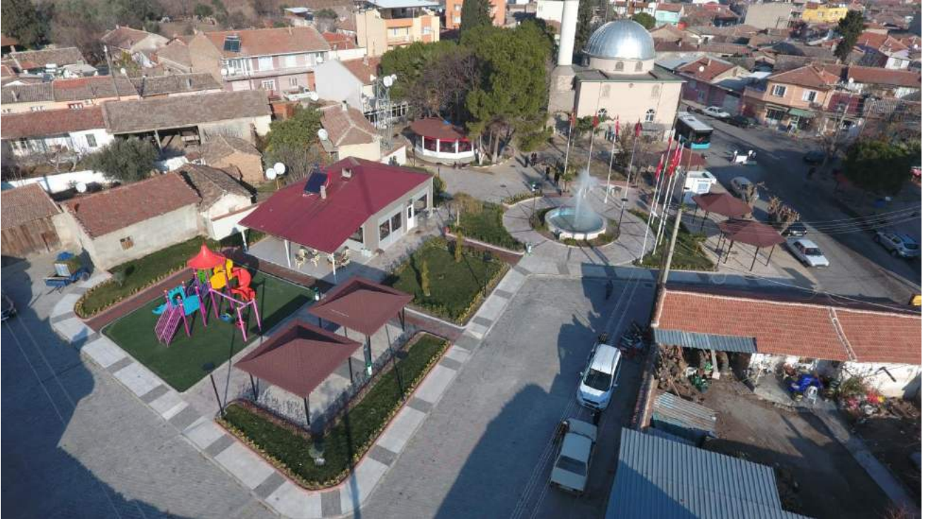
Paşaköy Mahallesi Meydan Düzenleme Çalışmaları Sonrası Yeni Görünümü

İlçemiz Adiloba Mahallesi Meydan Düzenlemesi kapsamında yer kaplaması değiştirilmiş, pergoleli oturma – dinlenme alanları ve banklar yerleştirilmiş, aydınlatma direkleri yenilenmiş, peyzaj çalışması da tamamlanarak halkımızın kullanımına sunulmuştur.