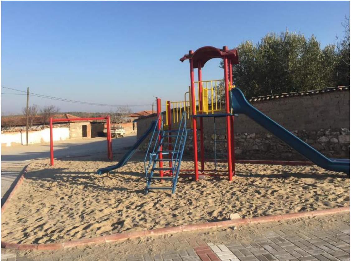
Kayışlar Mahallesi'ndeki Yenilenen Park Alanının Çalışma Sonrası Görünümü

İlçemiz Kayışlar Mahallesi'nde eskidiği için kullanılamaz durumdaki çocuk oyun grupları yenilenerek çocuklarımızın oynayabilecekleri bir alana dönüştürülmüştür.