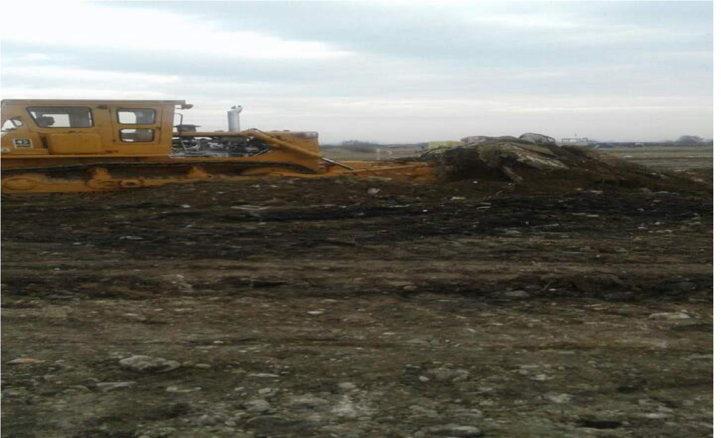
Paşaköy Mahallesi Depolama Sahası Temizlik Sırası Görünümü