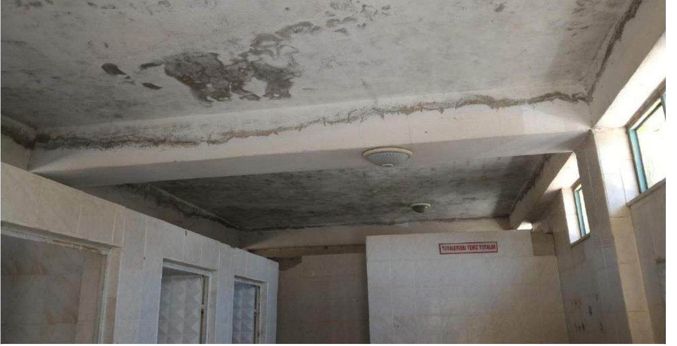
Saruhanbey Camii'ne Ait Tuvaletlerin Eski Hali