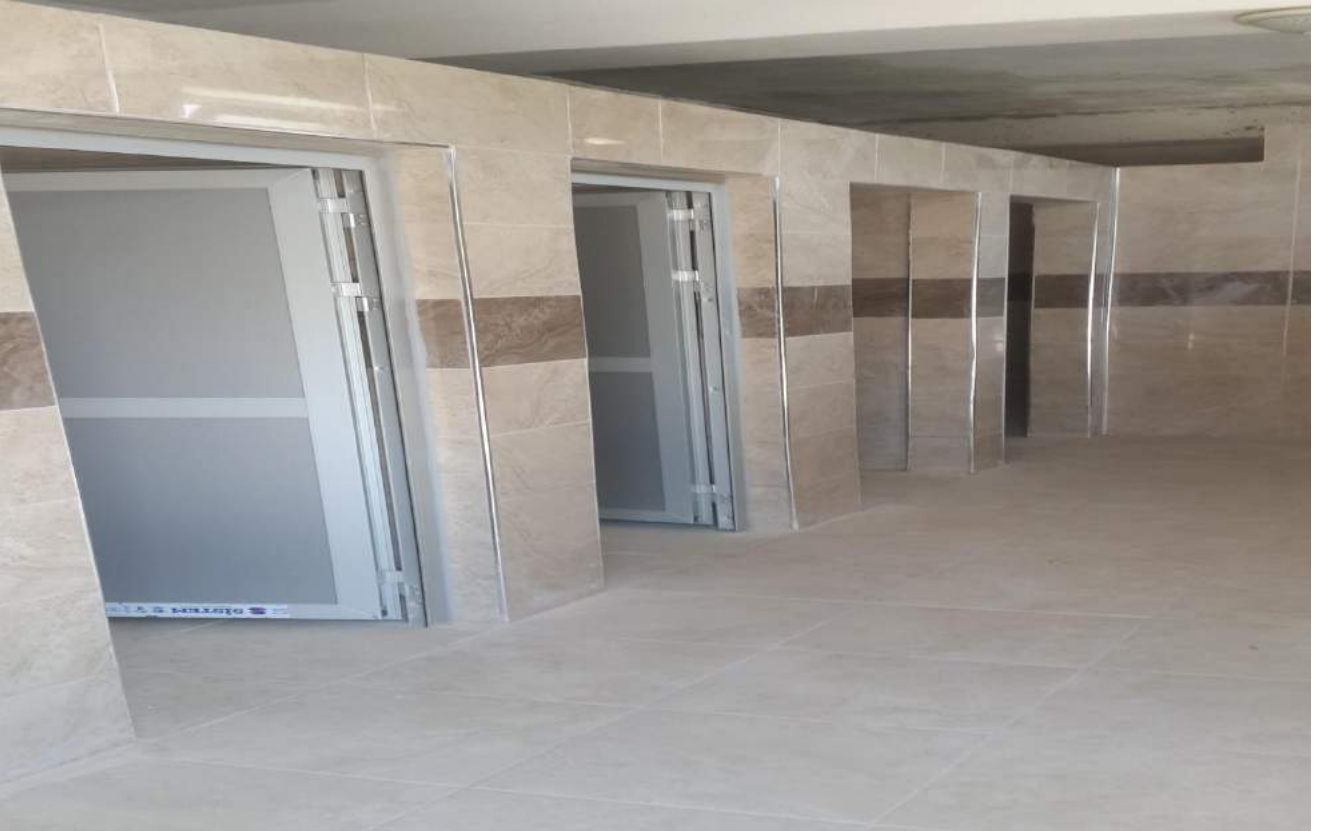
Saruhanbey Camii'ne Ait Tuvaletlerin Yeni Hali