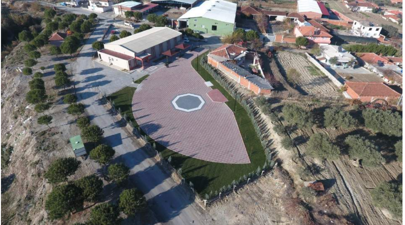
Gökçe Mahallesi Düğün Salonu Bahçesinin Çalışmalar Tamamlandıktan Sonraki Görünümü