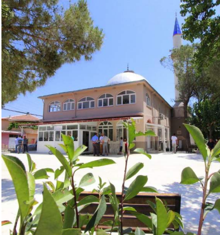
Paşaköy Mahallesi'nde Bulunan Çarşı Camii'nin Çalışma Sonrası Görünümü