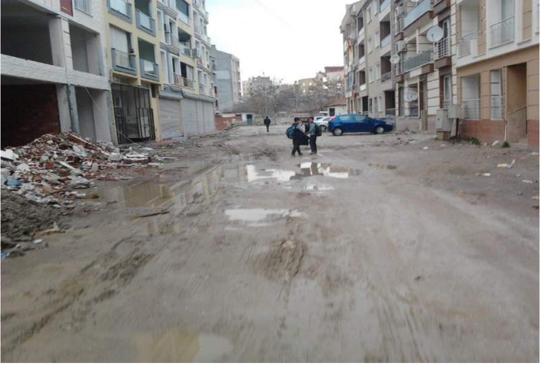
Atatürk Mahallesi Tahirler Sokak Taş Kaplama Çalışması Öncesi

İlçemiz merkezi, Alibeyli, Apak, Aydınlar, Bedeller, Çakmaklı, Çaltepe, Develi, Gökçe, Gümülcü, Halitpaşa, Hatıplar, Kayışlar, Kumkuyucak, Mütevelli, Nuriye, Pınarbaşı, Şatırlar ve Taşdibi Mahallelerinde 2016 yılında toplam 43.560,73 m2 beton parke taşı kaplama çalışması gerçekleştirilmiştir.