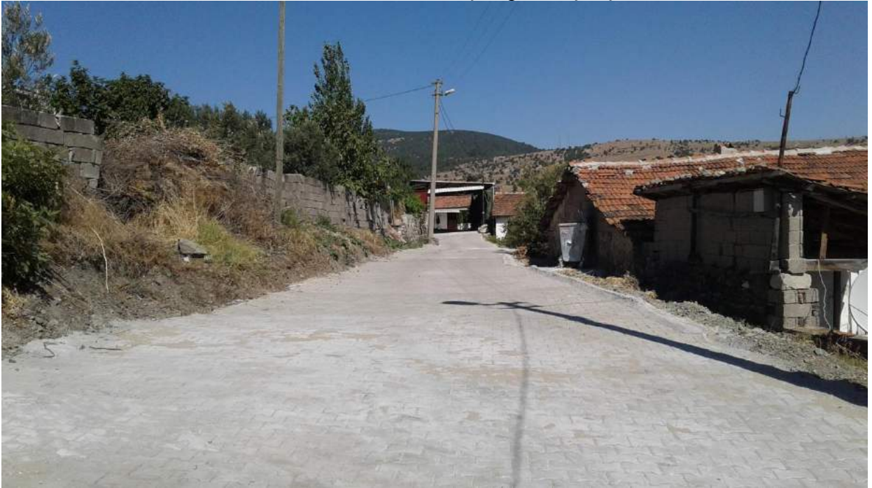
Şatırlar Mahallesi Taş Kaplama Çalışması