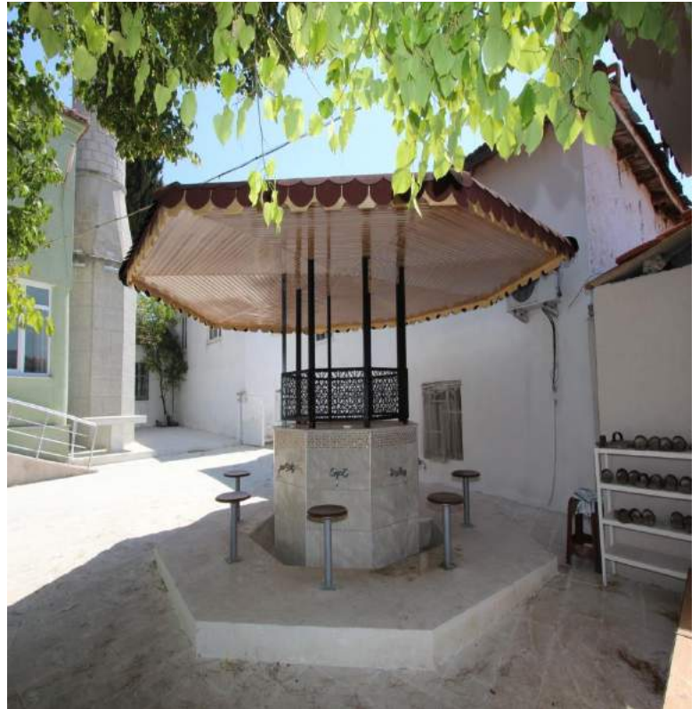
Çamlıyurt Camii'nin Çalışma Sonrası Yeni Hali