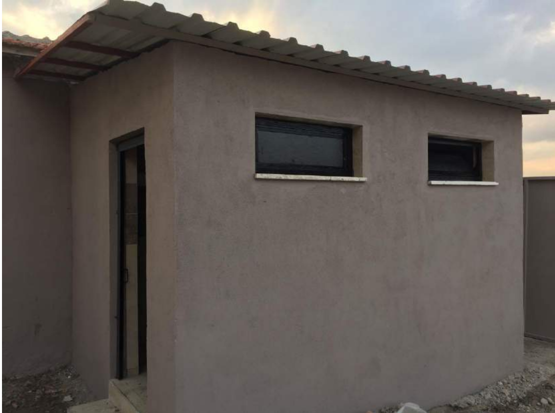
Tirkeş Mahallesi Tuvaletinin Yeni Hali

İlçemiz Tirkeş Mahallesi sakinlerinin talebi doğrultusunda meydana bay – bayan tuvaleti inşa edilerek halkımızın kullanımına açılmıştır.