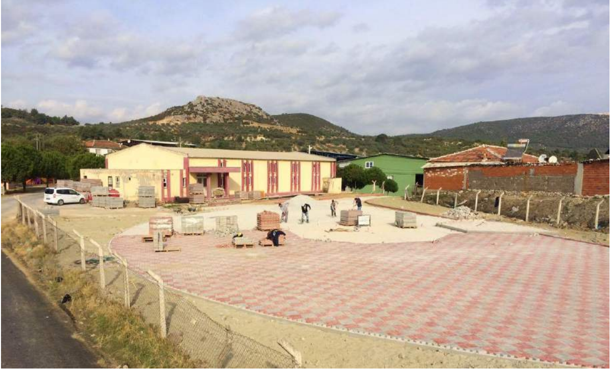
Gökçe Mahallesi Düğün Salonu Bahçesinin Çalışmalar Sırasındaki Görünümü

İlçemiz Gökçe Mahallesi düğün salonu bahçesinde daha önce atıl durumda bulunan eski şantiye alanına parke taşı kaplanıp peyzaj düzenlemeleri yapılarak yaz aylarında vatandaşlarımızın düğünlerini yapmaları için yazlık düğün alanı meydana getirilmiştir. Ayrıca kışlık düğün salonunun dış cephesi boyanmıştır.