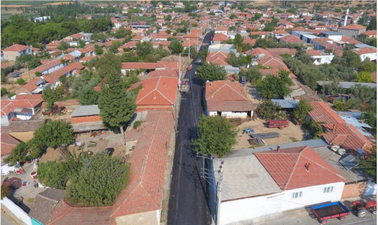
Kayışlar Mahallesi'nde Yapılan Asfalt Çalışması