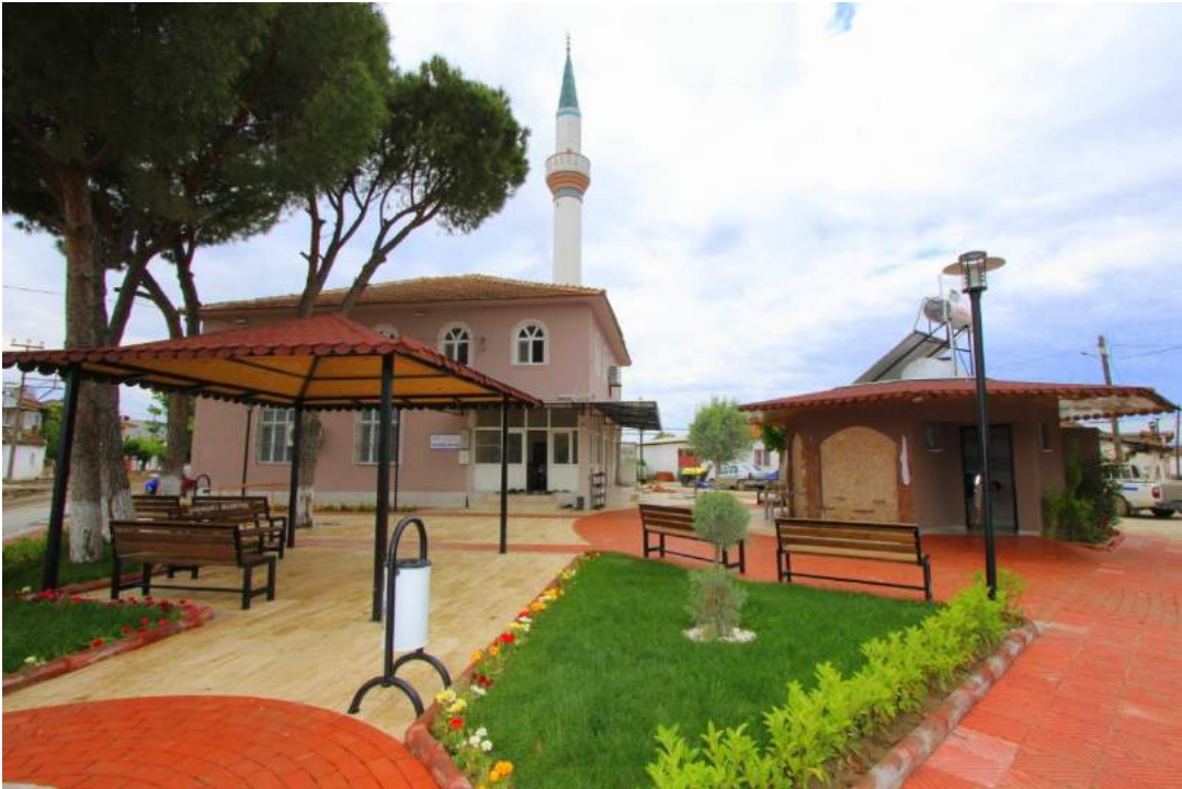
Adiloba Mahallesi'nde Bulunan Yeni Cami'nin Çalışma Sonrası Görünümü - 2