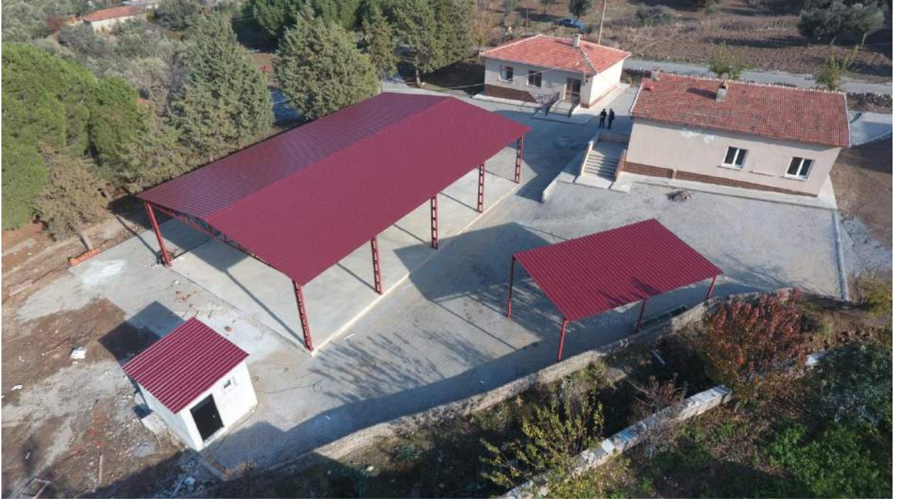
Bedeller Mahallesi Çok Amaçlı Kapalı Alanının Çalışma Sonrasındaki Durumu

İlçemiz Bedeller Mahallesi'nde bulunan alana vatandaşlarımızın düğün, cemiyet ve hayırlarını yapabilecekleri bir kapalı alan oluşturularak halkımızın hizmetine sunulmuştur.