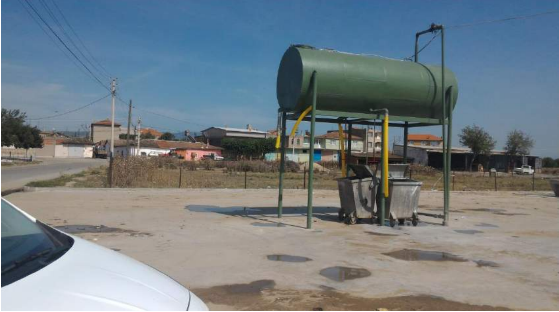
Mütevelli Mahallesi'ne yapılan Tarımsal Sulama Deposu

İlçemiz Mütevelli Mahallesi'nde bulunan stadyumun yanındaki alana tarımsal sulama deposu yapılarak ilaçlama yapan çiftçilerimizin kullanımına sunulmuştur. Ayrıca yanına marul, maydonoz vs. ürünlerin yıkanabileceği bir ürün yıkama havuzu pazarcı esnafının kullanımına sunulmuştur.