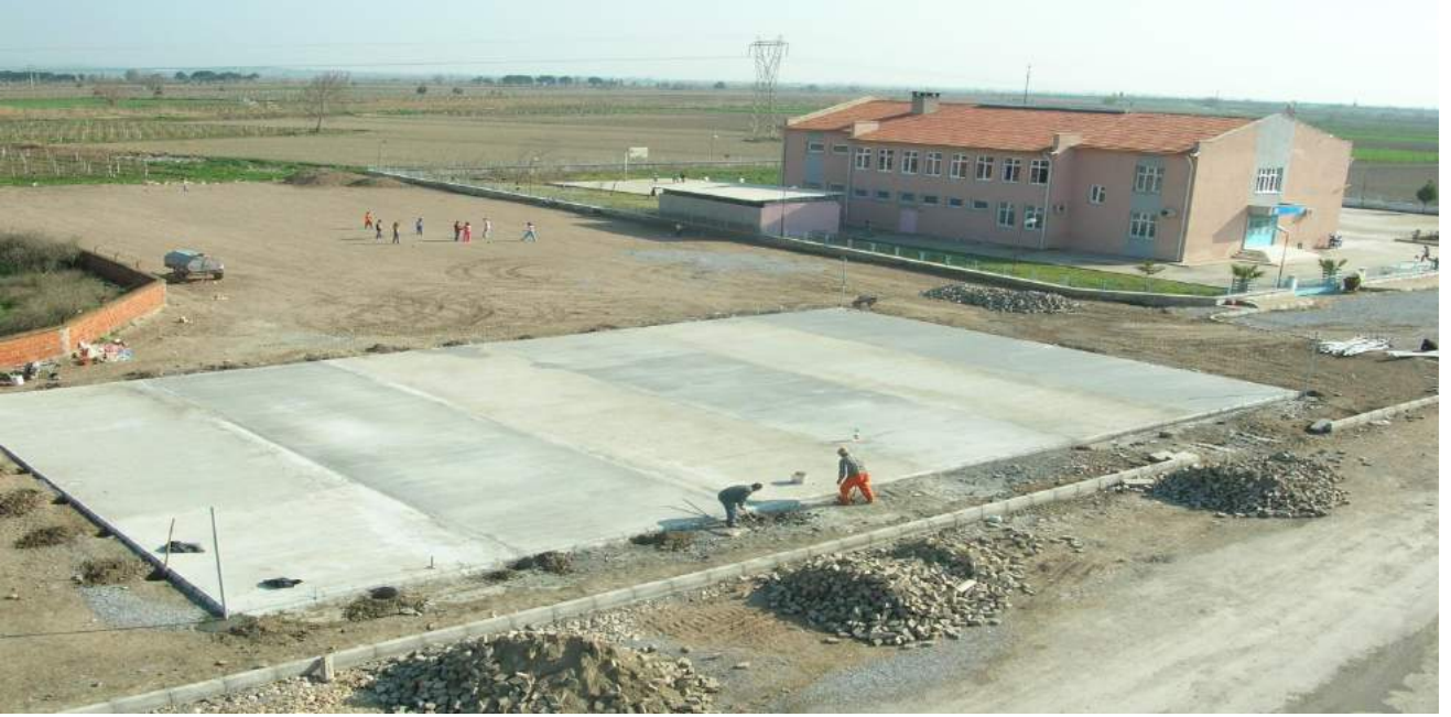
Yılmaz Mahallesi Çalışmaları Sırasındaki Eski Görünümü

Yılmaz Mahallesi Atatürk Caddesi üzerine Belediyemizce peyzaj çalışmaları da tamamlanan çim halı saha, çocuk oyun grupları, pergoleli oturma alanları ile bütünlük oluşturan Kafeterya binası inşası tamamlanarak halkımızın kullanımına sunulmuştur.