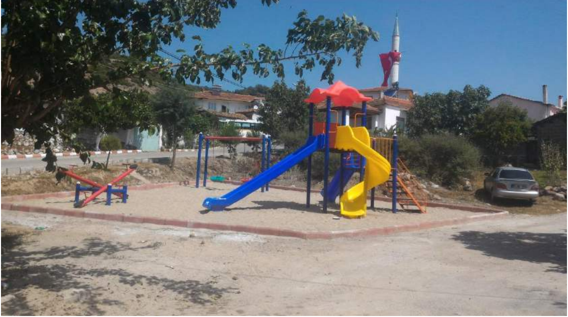
Hatıplar Mahallesi'ne Yapılan Park Alanının Çalışma Sonrası Görünümü

İlçemiz Hatıplar Mahallesi'nde atıl durumda bulunan alana, çocuk oyun grubu yerleştirilerek çocuklarımızın oynayabilecekleri bir park oluşturulmuştur.