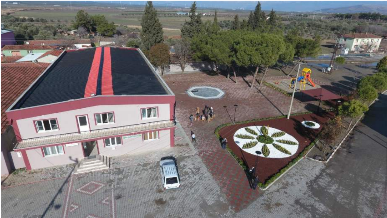
Kayışlar Mahallesi Çok Amaçlı Kültür Sitesi ve Düğün Salonunun Yeni Hali