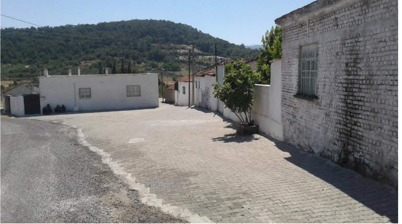
Hatıplar Mahallesi Taş Kaplama Çalışması - 2