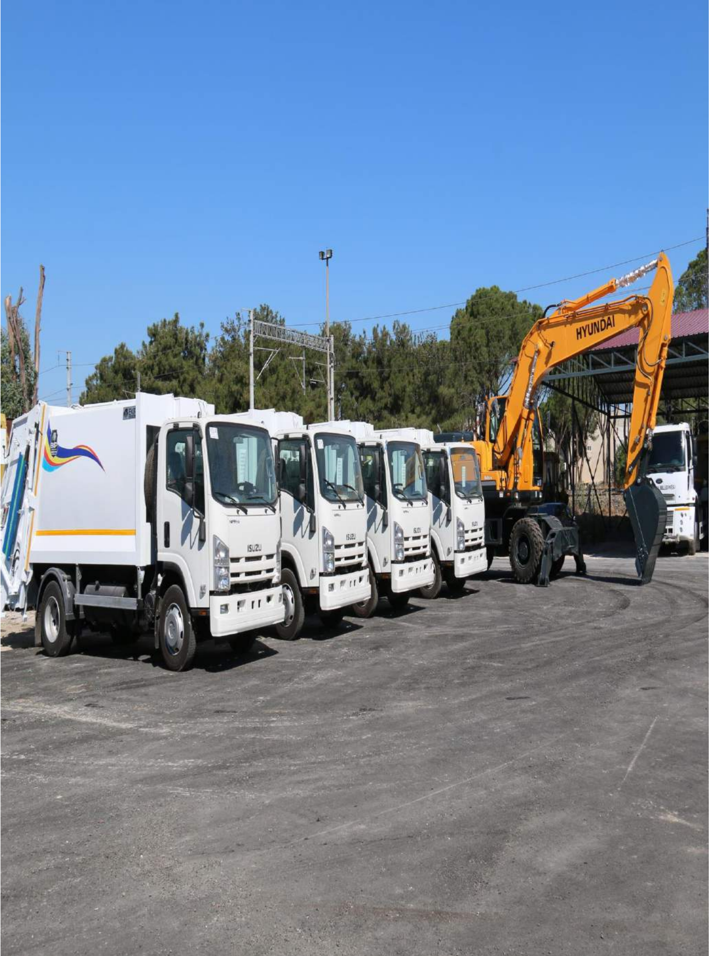
Saruhanlı Belediyesi 01/01/2016 – 31/12/2016 Arası Faaliyet Raporu www.saruhanli.bel.tr