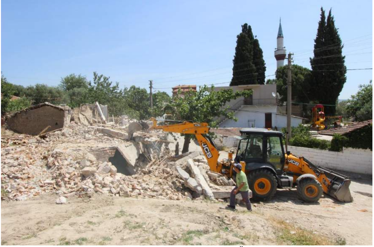
Taşdibi Mahallesi'ne Çok Amaçlı Salon Yapımı Öncesi Eski Görünümü

Taşdibi Mahallesi'ne çok amaçlı düğün salonu, otoparkı ve çevre düzenlemesi ile birlikte tamamlanarak Taşdibi Mahallesi ve çevresinde bulunan mahallelerin de kullanabileceği modern bir kapalı alana kavuşmuştur.