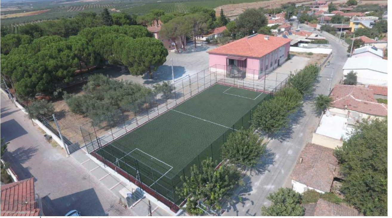
İshakçelebi Mahallesi'ne Yapılan Halı Sahanın Çalışma Sonrasındaki Görünümü

İlçemiz İshakçelebi Mahallesi İlk ve Ortaokulu'nun yanında bulunan alana öğrencilerimizin gençlerimizin kullanımı için çim halı saha kazandırılmıştır.