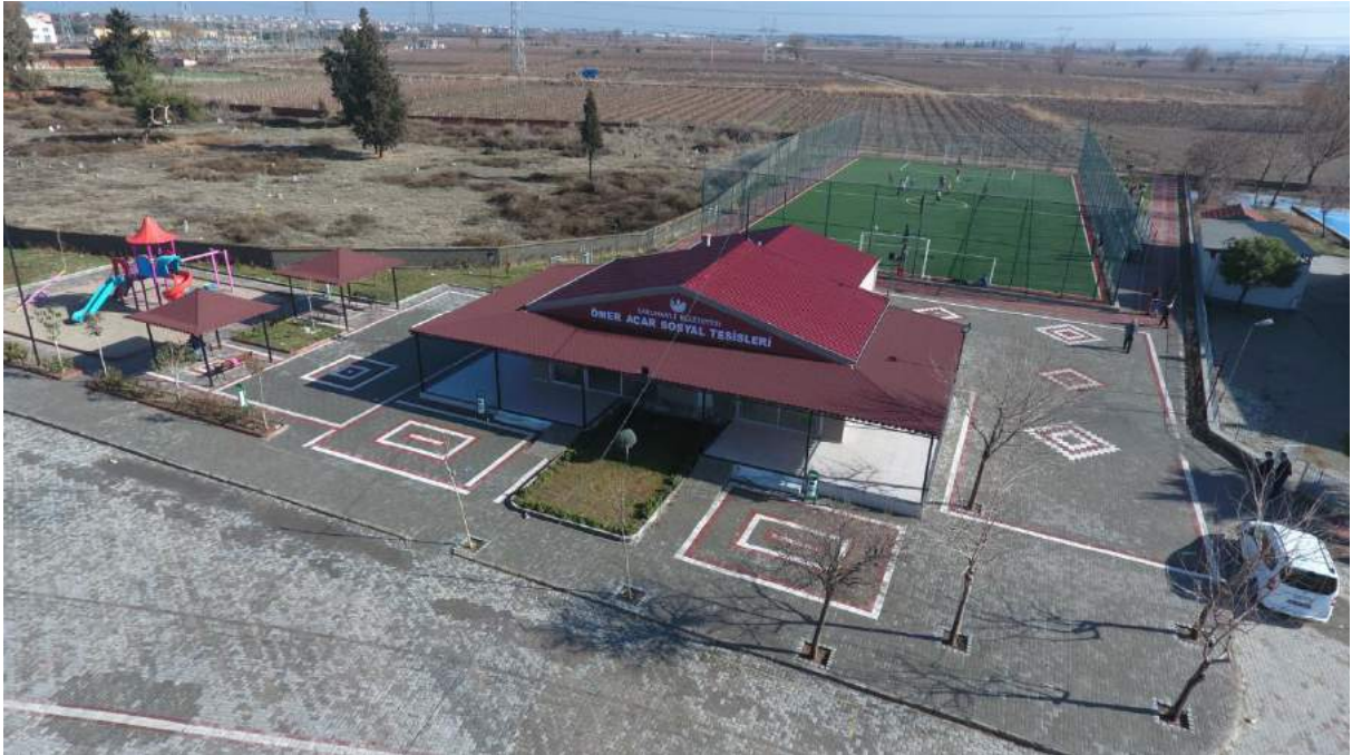
Yılmaz Mahallesi Çalışmaları Sonrasındaki Yeni Görünümü

İlçemiz Paşaköy Mahallesinde meydan düzenlemesi çalışması kapsamında kafeterya, oturma - dinlenme alanları, süs havuzu, çocuk oyun alanı ve otopark yapımı tamamlanarak yeni bir görünüme kavuşturulmuştur.