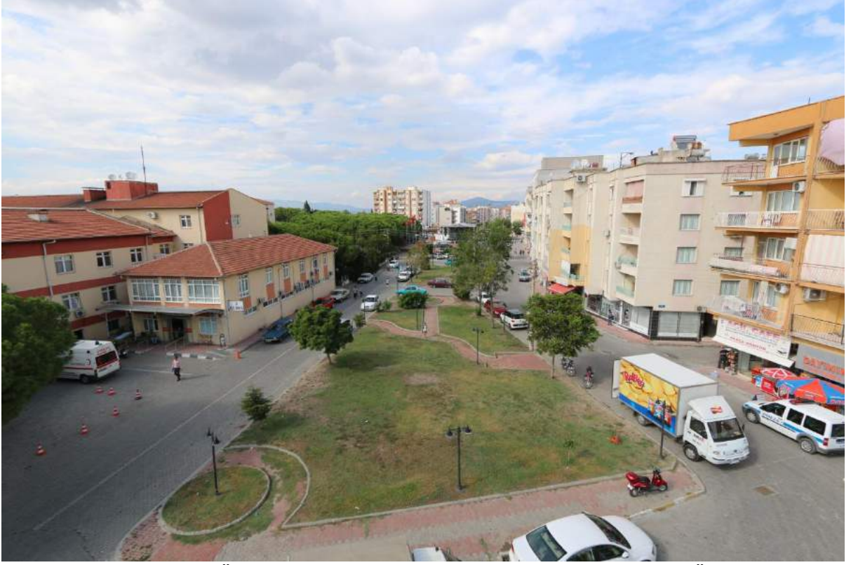
Cumhuriyet Mahallesi Özdemirler Sokak'ta Bulunan Yeşil Alanın Çalışma Öncesi Durumu

İlçemiz Cumhuriyet Mahallesi Özdemirler Sokak'ta bulunan yeşil alana pergoleli oturma alanları, araç otoparkı ve peyzaj çalışması gerçekleştirilerek vatandaşlarımızın ve hasta yakınlarının zaman geçirebileceği bir alan oluşturulmuştur.