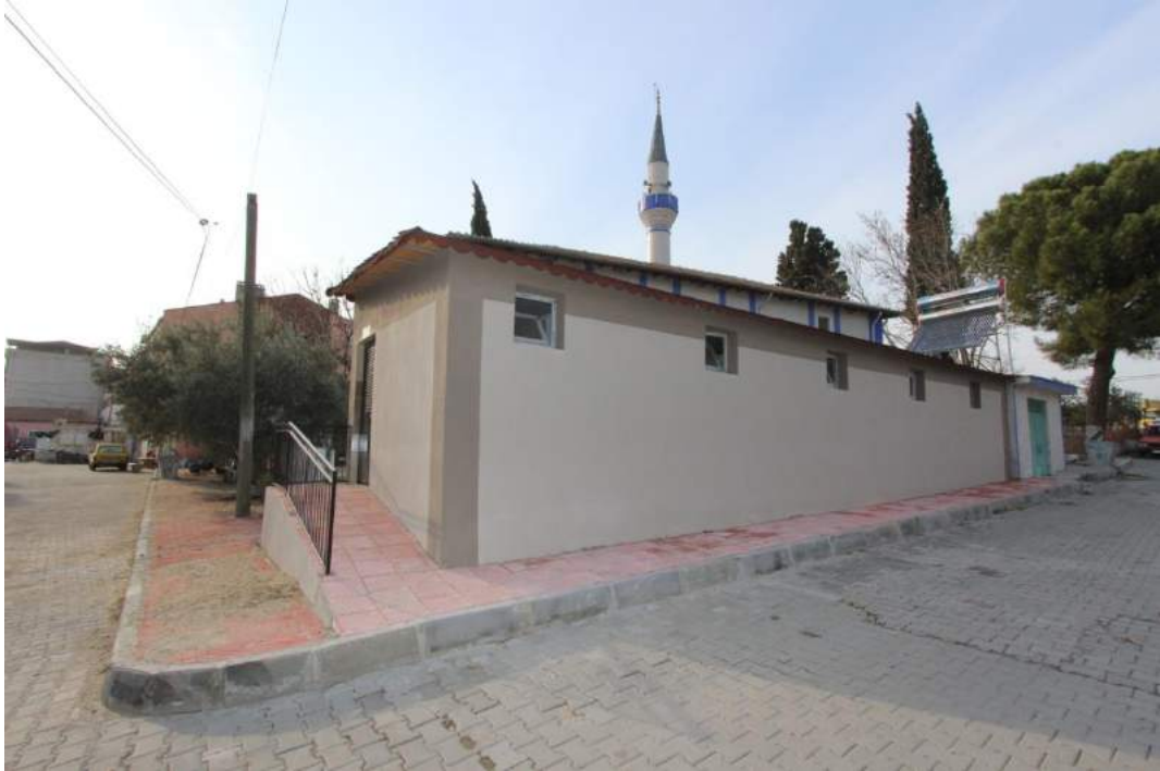
Nuriye Mahallesi Tuvaletinin Yeni Hali