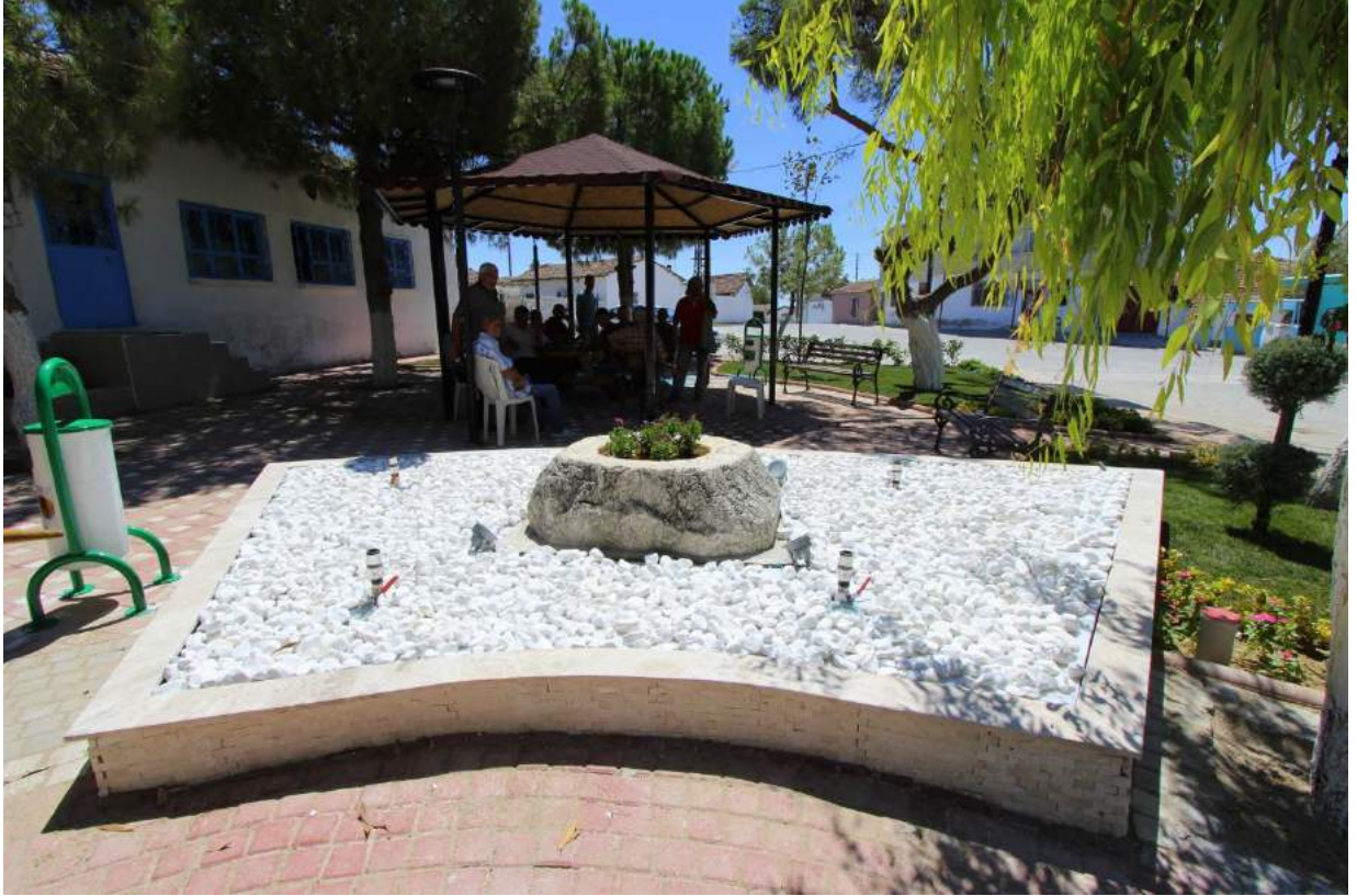
Çakmaklı Mahallesi Meydanının Düzenleme Sonrası Görünümü