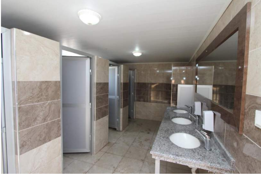
Nuriye Mahallesi Tuvaletinin Yeni Hali - 2

İlçemiz Tirkeş Mahallesi sakinlerinin talebi doğrultusunda meydana bay – bayan tuvaleti inşa edilerek halkımızın kullanımına açılmıştır.