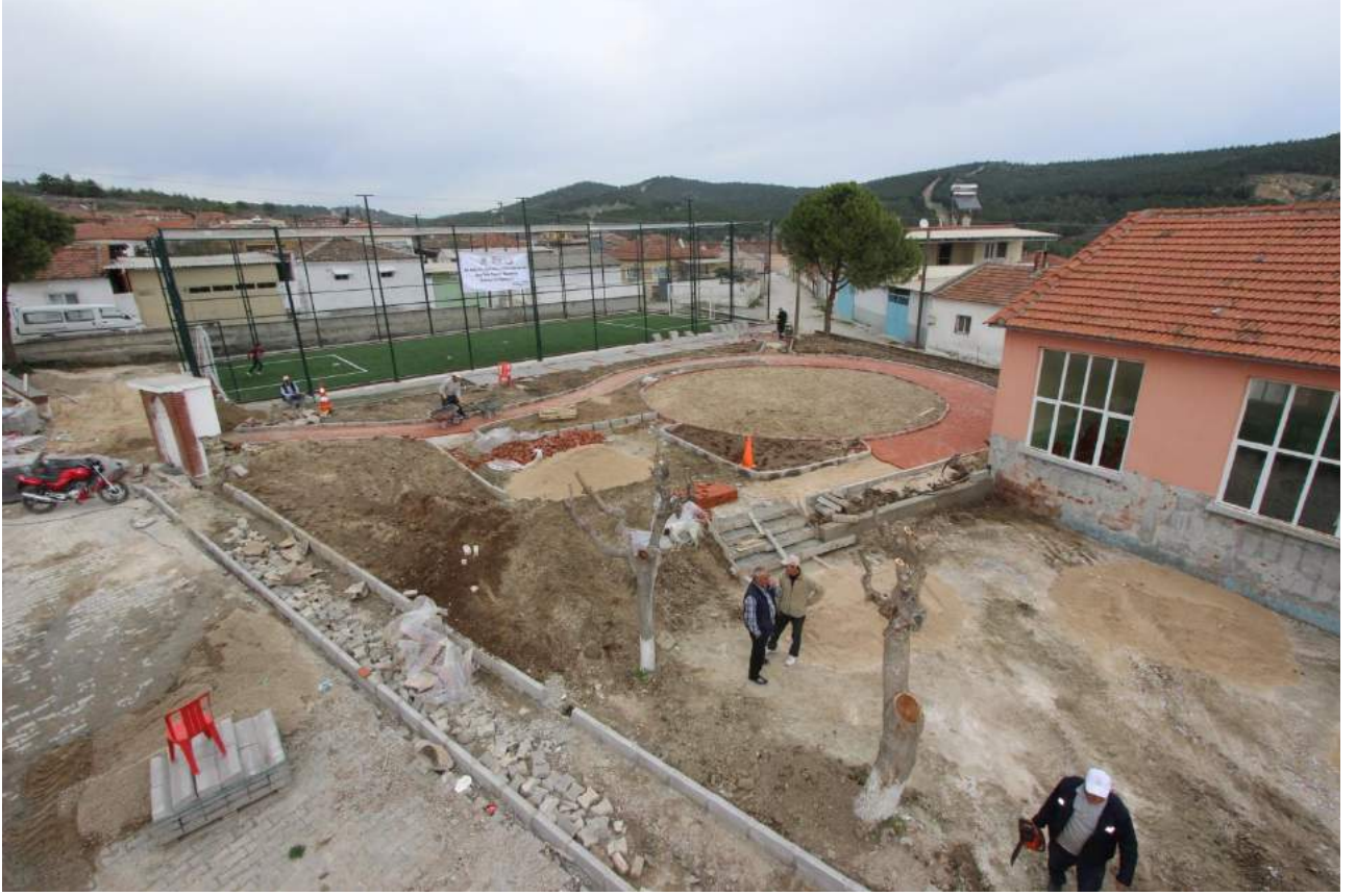
Apak Mahallesi Çevre Düzenlemesi Çalışmaları Sırasındaki Görünüm

İlçemiz Apak Mahallesi'nde yapılan çevre düzenlemeleri kapsamında halı saha, pergoleli oturma - dinlenme alanı ve çocuk parkı alanı yapımı gerçekleştirilerek halkımızın kullanımına sunulmuştur.