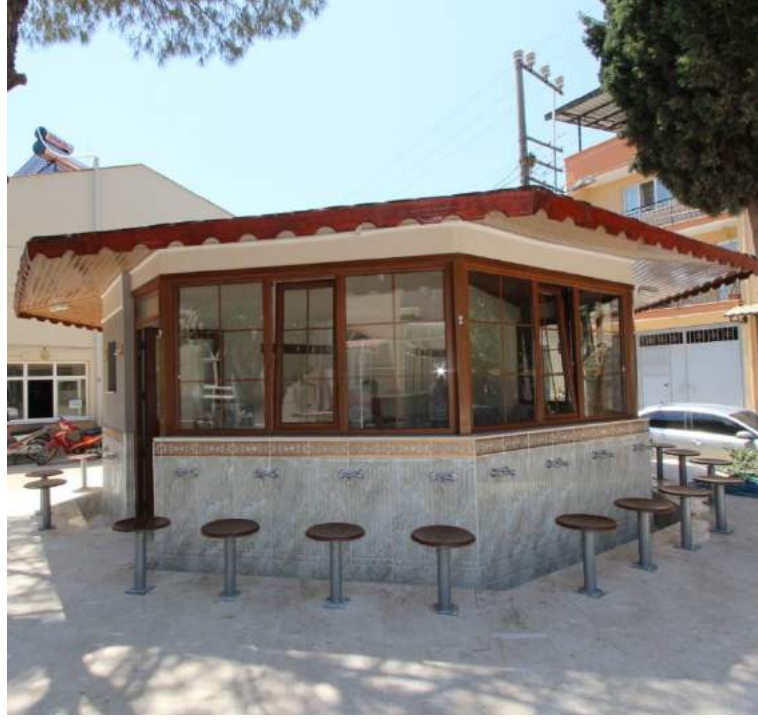
Paşaköy Mahallesi'nde Bulunan Çarşı Camii Şadırvanının Çalışma Sonrası Görünümü

İlçemiz Paşaköy Mahallesi Çarşı Camii bahçesi peyzaj düzenlemeleri kapsamında zemin döşemesi yenilenmiş, açık ve kapalı kullanım alanı olan şadırvan ve bay bayan tuvalet inşaatı yapılmıştır.