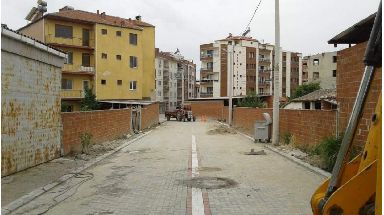
Cumhuriyet Mahallesi Çınar Sokak Taş Kaplama Çalışması