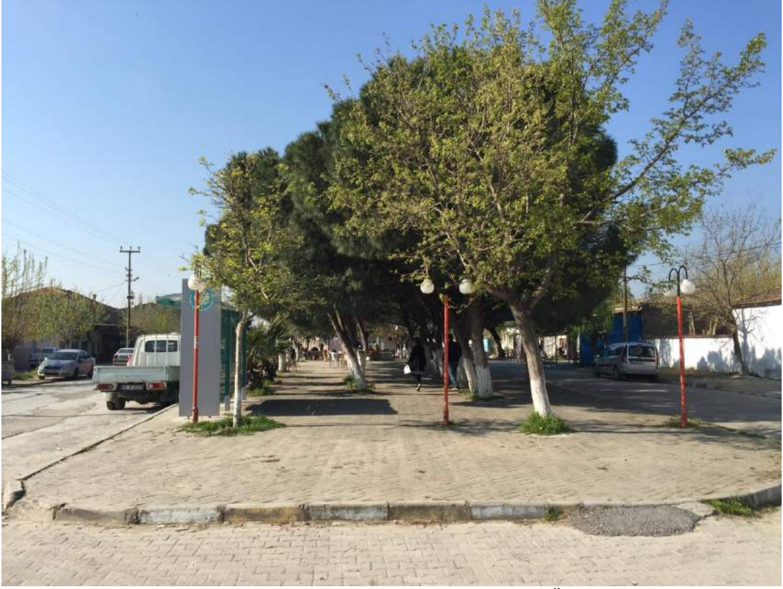
Adiloba Mahallesi Meydanının Düzenleme Çalışması Öncesi Görünümü