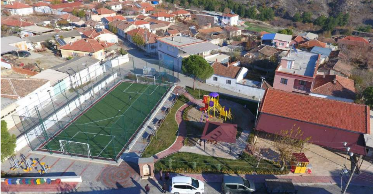
Apak Mahallesi Çevre Düzenlemesi Çalışmalarının Tamamlanmasının Sonrasındaki Görünüm