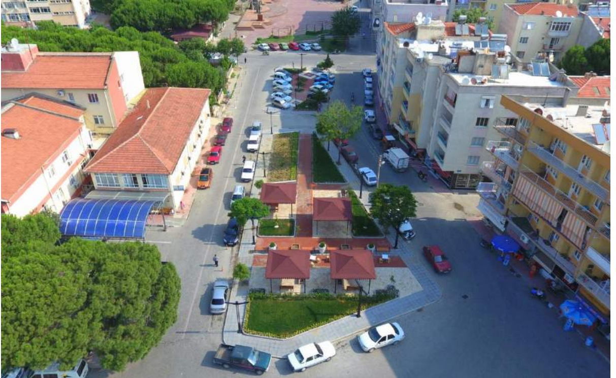
Cumhuriyet Mahallesi Özdemirler Sokak'ta Bulunan Yeşil Alanın Çalışma Sonrası Durumu