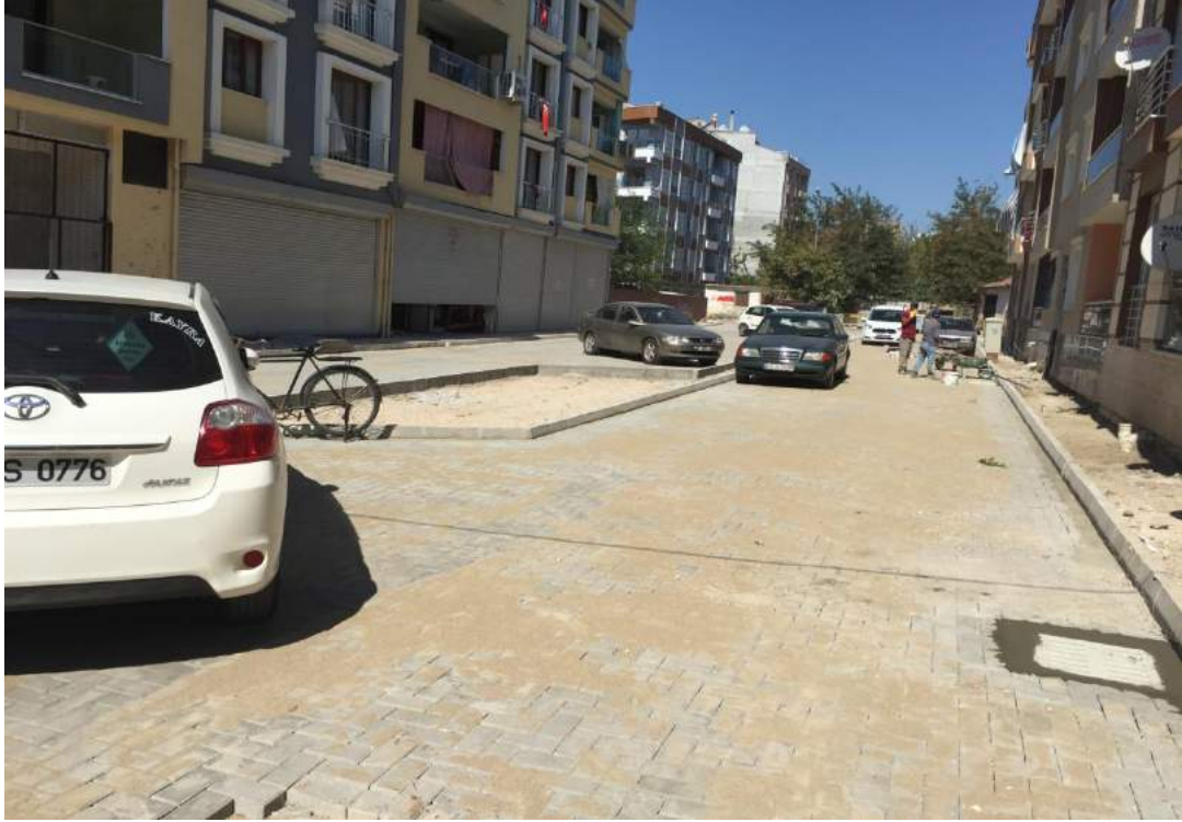
Atatürk Mahallesi Tahirler Sokak Taş Kaplama Çalışması Sonrası