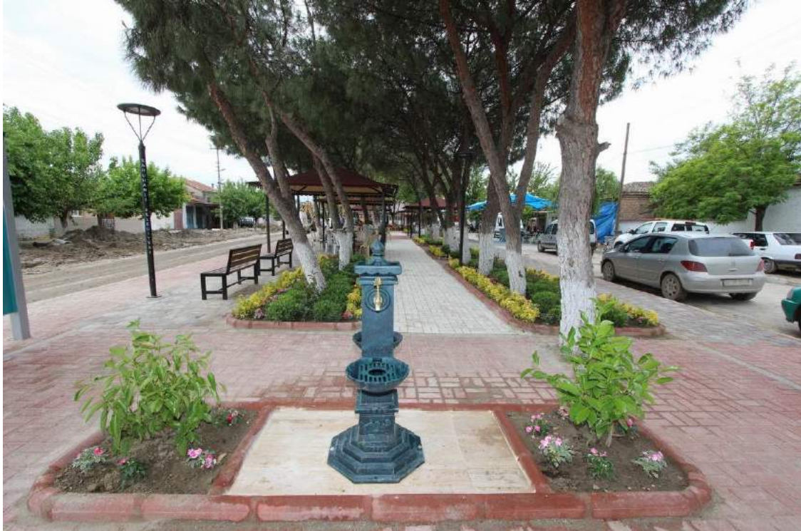
Adiloba Mahallesi Meydanının Düzenleme Çalışması Sonrası Görünümü

İlçemiz Çakmaklı Mahallesi Meydan Düzenlemesi kapsamında parke taşı kaplaması gerçekleştirilmiş, süs havuzu yapılmış, parke taşı kaplanıp alan çimlendirilerek güzel bir görünüm elde edilmiştir.