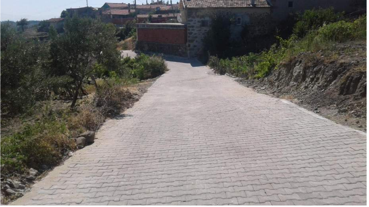
Şatırlar Mahallesi Taş Kaplama Çalışması – 2