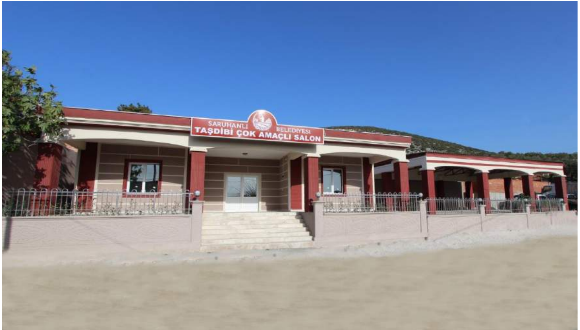
Taşdibi Mahallesi'ne Çok Amaçlı Salon Yapımı Sonrası Yeni Görünümü