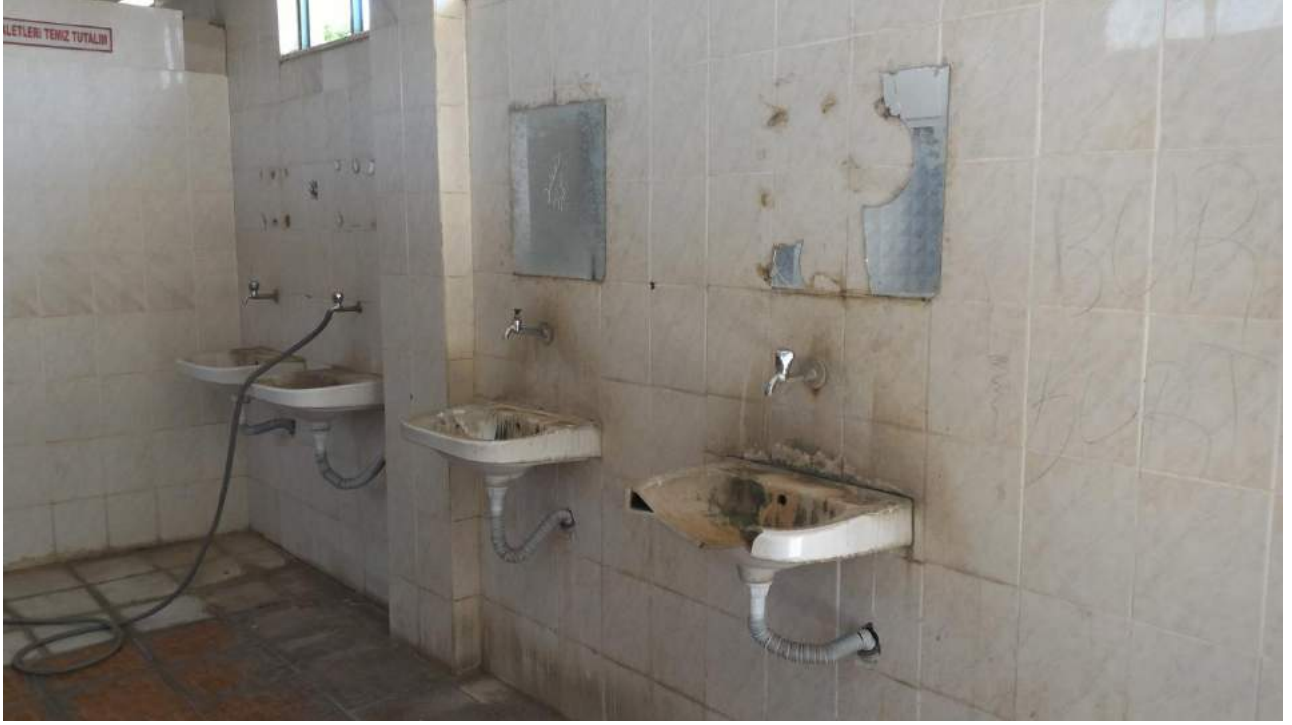
Saruhanbey Camii'ne Ait Lavabolarının Eski Hali