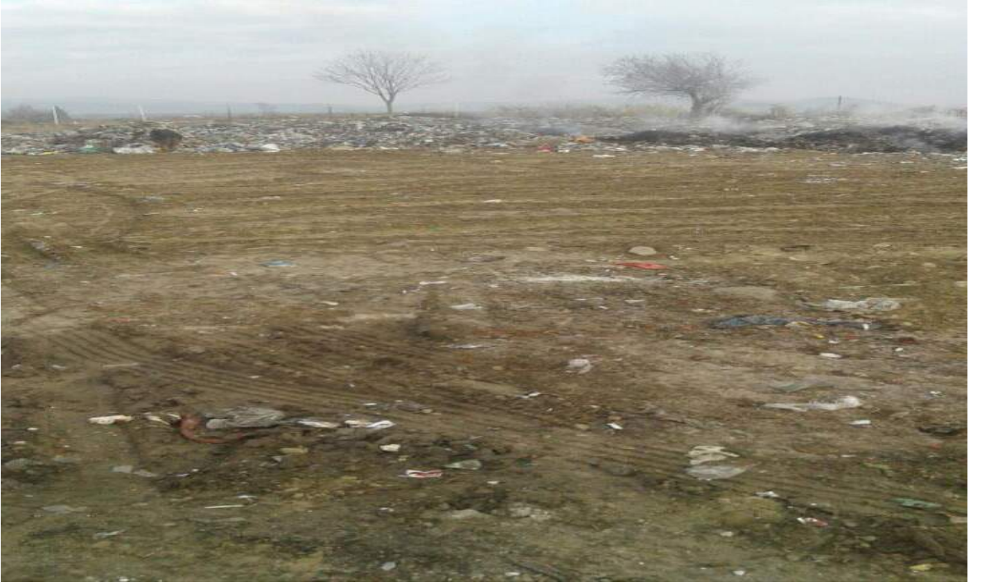
Paşaköy Mahallesi Depolama Sahası Temizlik Sırası Görünümü