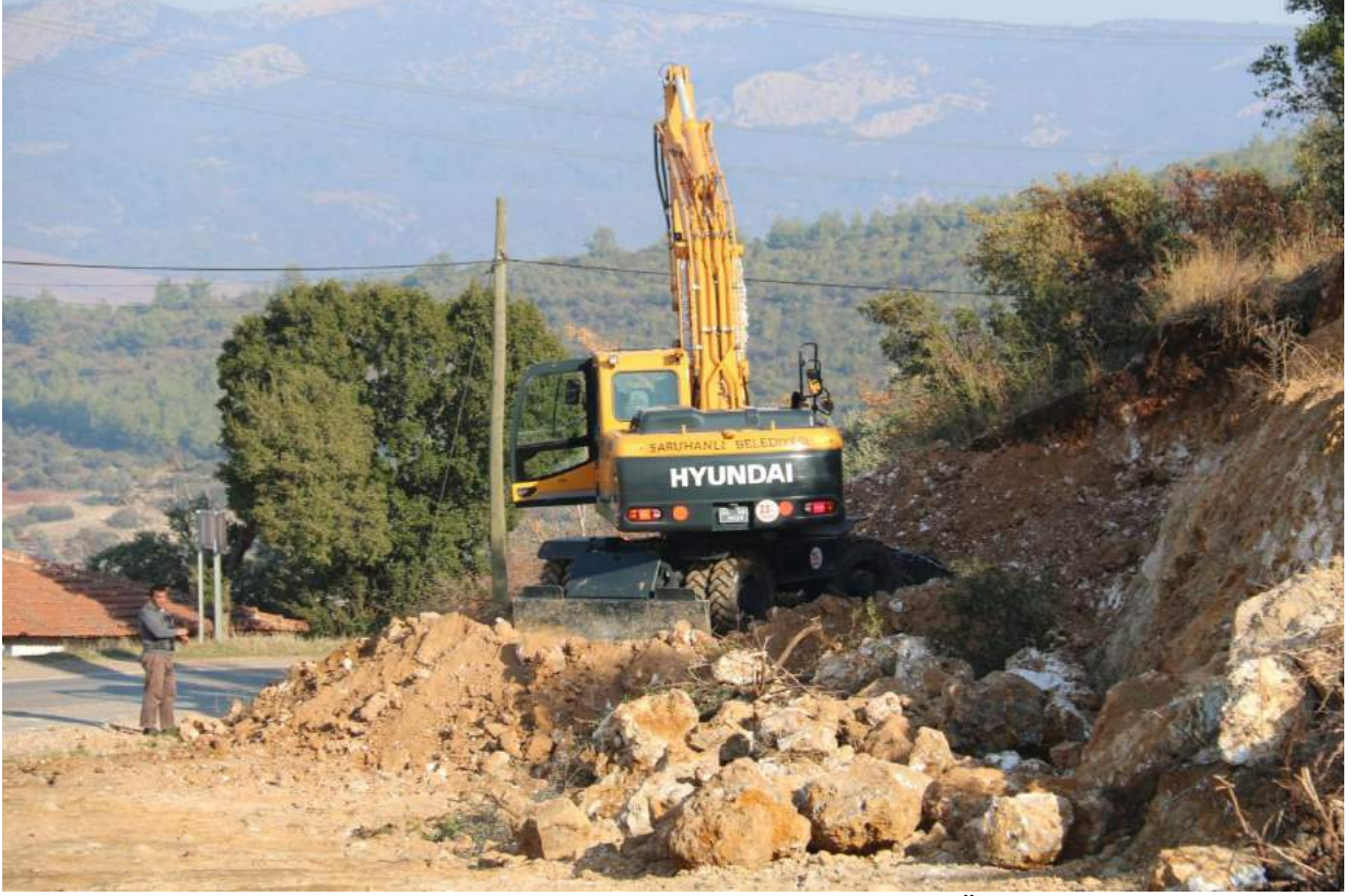
Heybeli Mahallesi Viraj Genişletme Çalışması Öncesi

İlçemiz Heybeli Mahallesi sınırlarında bulunan keskin viraj, trafiğin rahatlamasıyla araçların kaza yapma risklerinin en aza indirilmesi amacıyla genişletilmiştir.