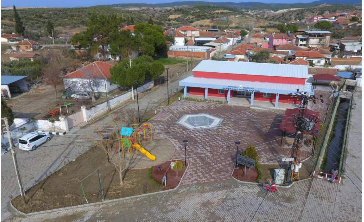
Gümülceli Mahallesi Yeni Düğün Salonu