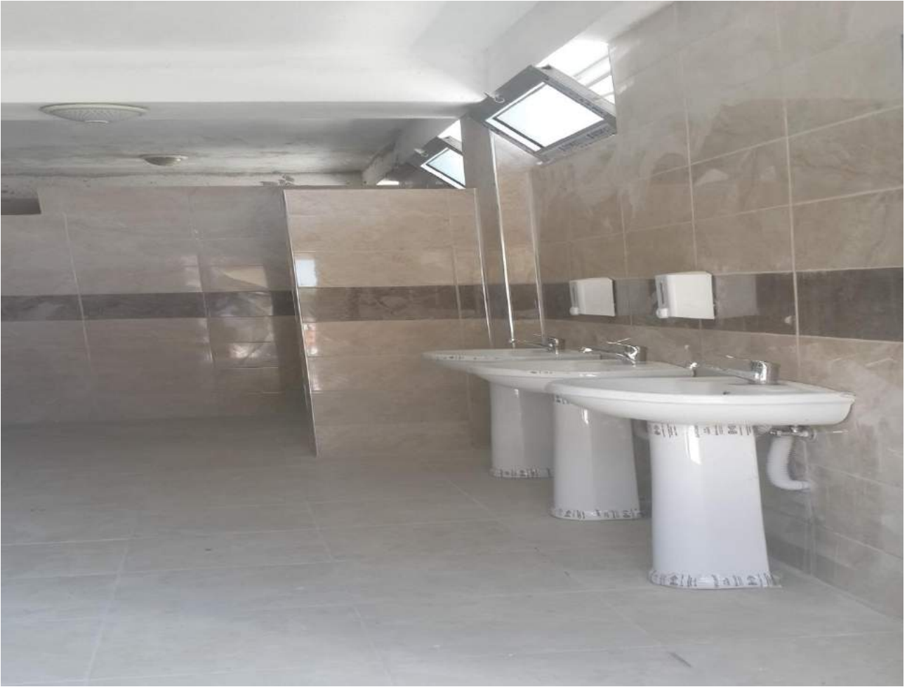
Saruhanbey Camii'ne Ait Lavabolarının Yeni Hali