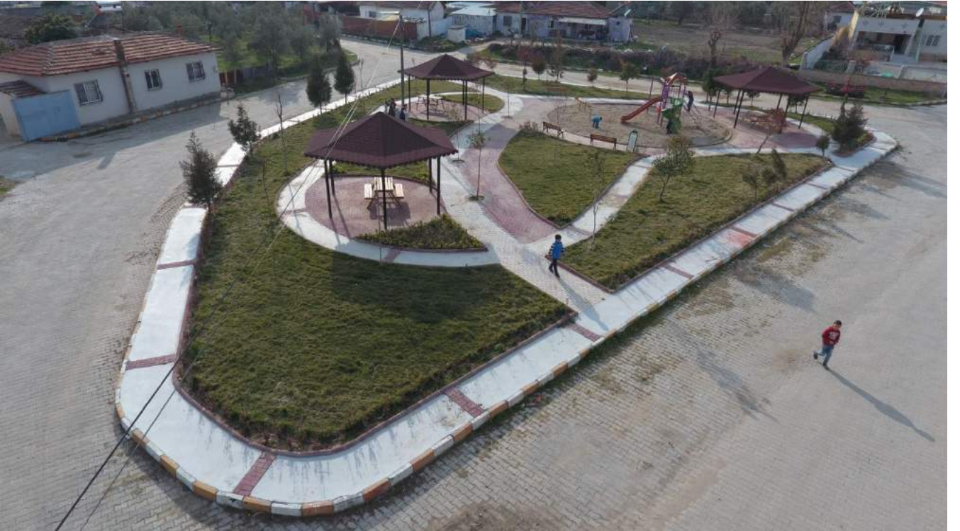
Kumkuyucak Mahallesi Yeşil Alan Düzenlemesi Sonrası