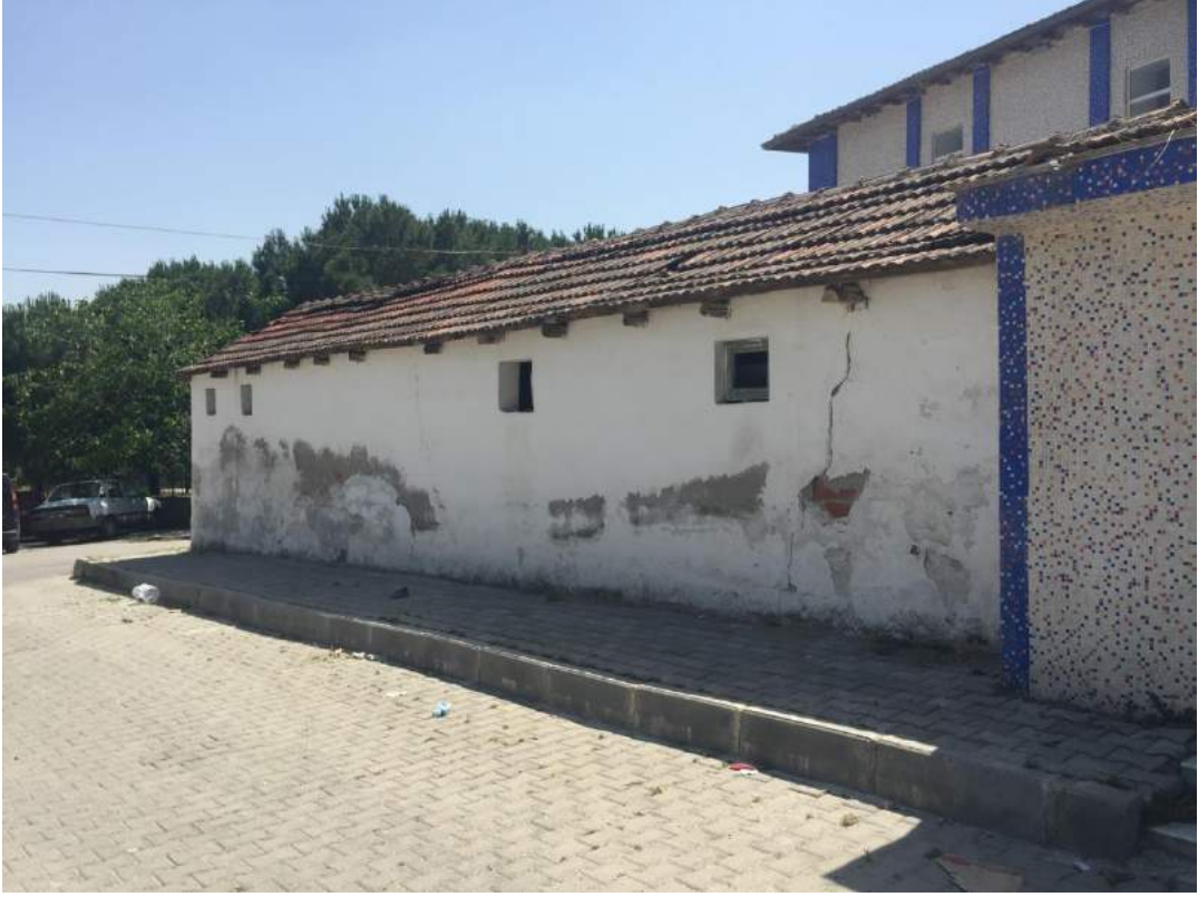
Nuriye Mahallesi Tuvaletinin Eski Hali