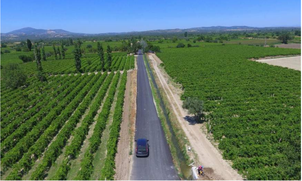
Adiloba ile Kepenekli Mahallelerini Birbirine Bağlayan Ova Yolu Asfalt Çalışması

İlçemiz merkezi, Azimli, Bedeller, Büyükbelen, Çullugörece, Dilek, Gökçe, Gümülceli, Hacırahmanlı, Halitpaşa, Heybeli, Kayışlar, Kemiklidere, Kepenekli, Koldere, Mütevelli, Nuriye, Paşaköy ve Sarıçam mahallelerinde 2016 asfalt sezonunda toplam 9.030,85 ton sıcak yol asfaltlama çalışması gerçekleştirilmiştir.