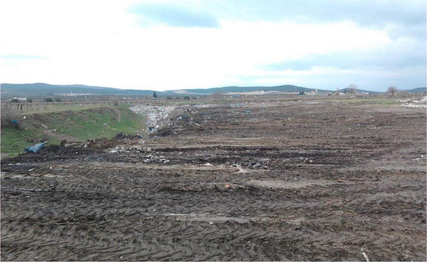
İshakçelebi Mahallesi Depolama Sahası Temizlik Sonrası Görünümü