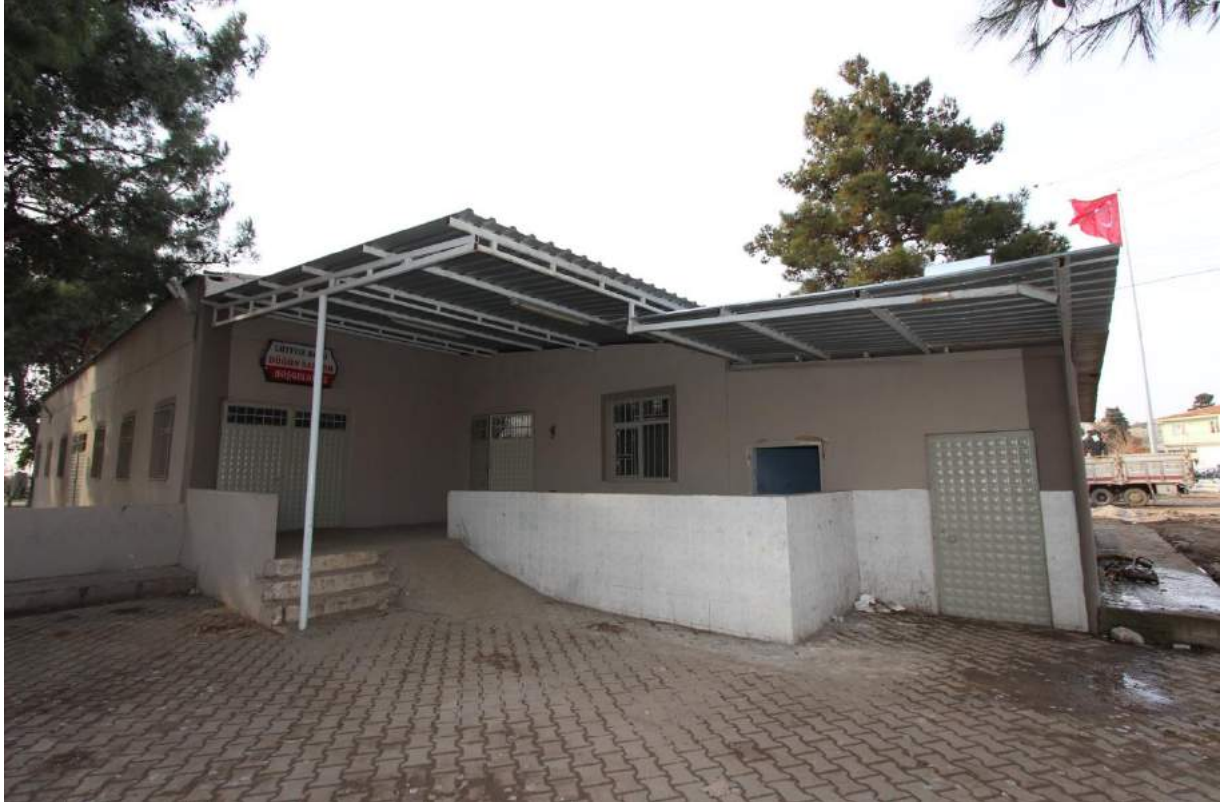
Lütfiye Mahallesi Düğün Salonunun Boya Yenilemesi Sonrasındaki Durumu

İlçemiz Lütfiye Mahallesi'nde bulunan düğün salonunun dış cephe boyası yenilenmiştir.