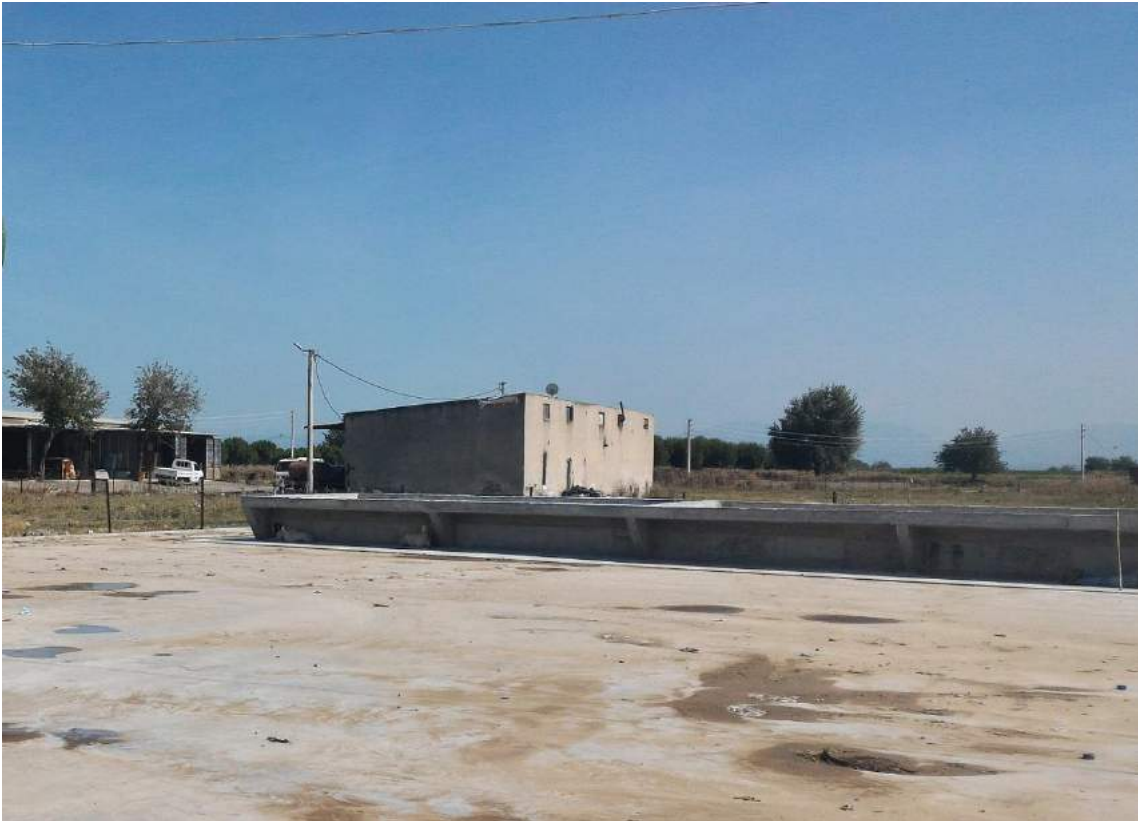
Mütevelli Mahallesi'ne Yapılan Ürün Yıkama Havuzu