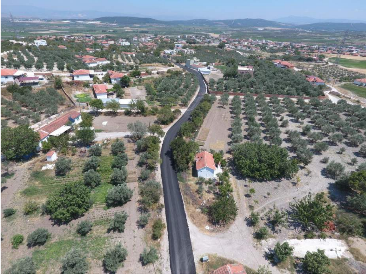
Dilek Mahallesi'nde Yapılan Asfalt Çalışması