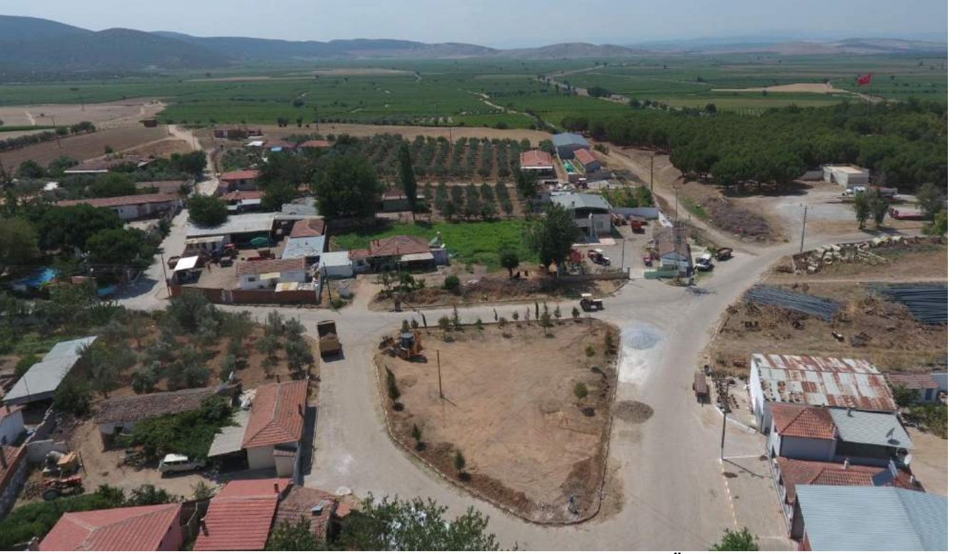
Kumkuyucak Mahallesi Yeşil Alan Düzenlemesi Öncesi

İlçemiz Kumkuyucak Mahallesi'nde bulunan park alanında pergoleli oturma alanları, çocuk oyun grupları yerleştirilerek ailelerin zaman geçirebileceği bir alan kazandırılmıştır.