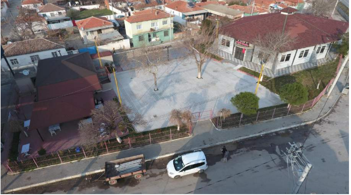
İshakçelebi Mahallesi Açık Düğün Salonu'nun Çalışma Sonrası Son Hali

İlçemiz İshakçelebi Mahallesi açık düğün salonu çevre düzenlenmesi kapsamında sahne seramikleri yenilenmiş, taş döşenmiş, mevcut pergoleler yenilenmiş, peyzaj çalışmaları yapılmıştır. Ayrıca bir bay - bayan tuvalet yapılarak halkımızın kullanımına sunulmuştur.