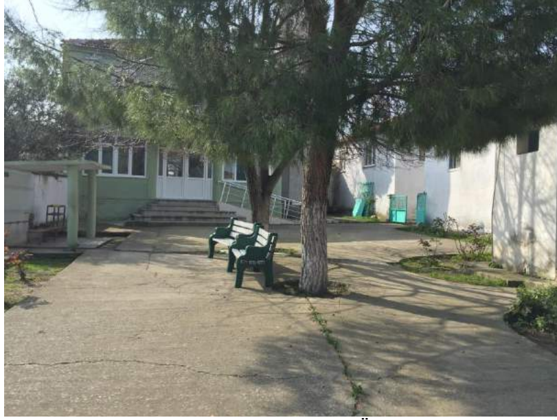
Çamlıyurt Camii'nin Çalışmadan Önceki Eski Hali

İlçemiz Çamlıyurt Mahallesi camii bahçesinde yapılan peyzaj düzenlemeleri kapsamında zemin döşemesi yenilenmiş, yeni bir şadırvan inşa edilmiş, bay - bayan tuvaletleri yenilenmiştir.