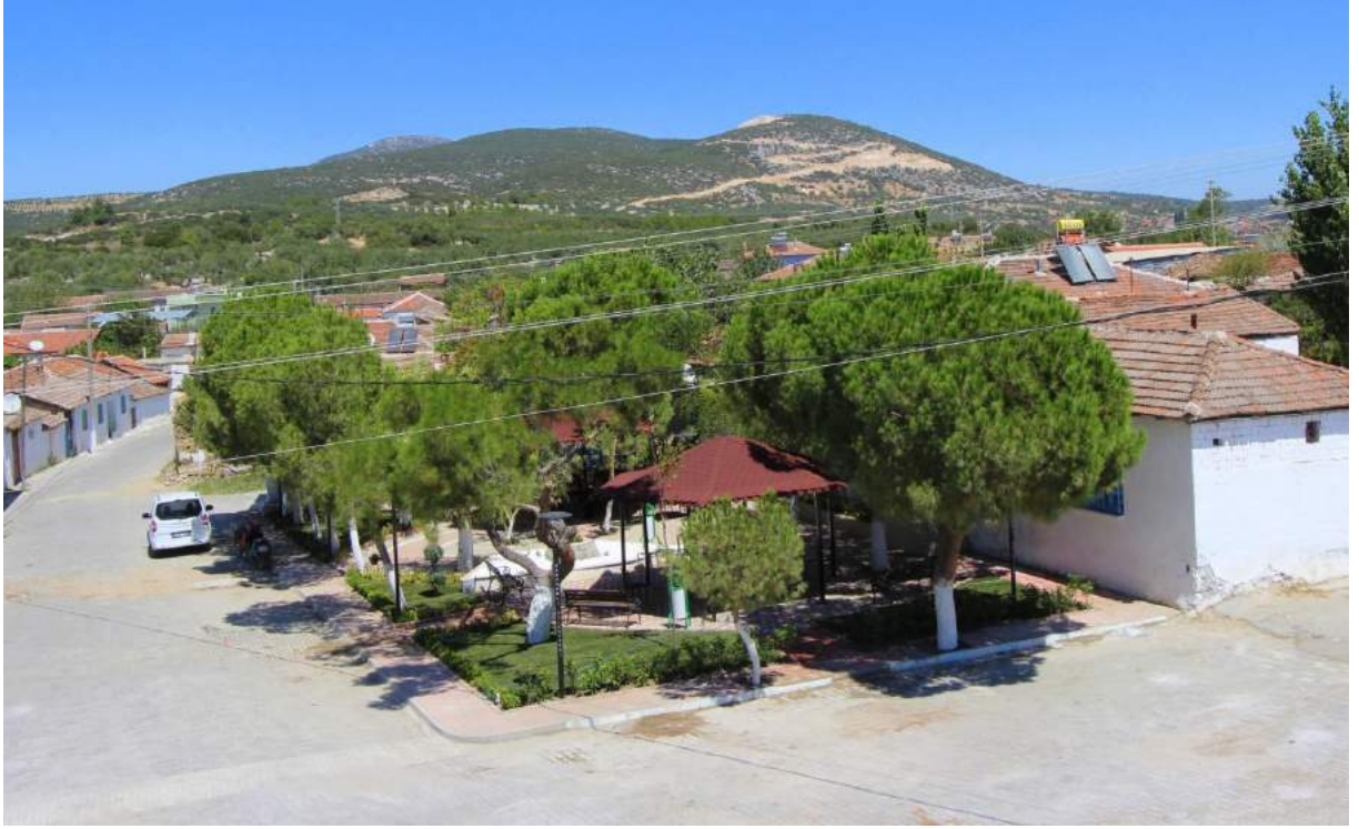
Çakmaklı Mahallesi Meydanının Düzenleme Sonrası Görünümü