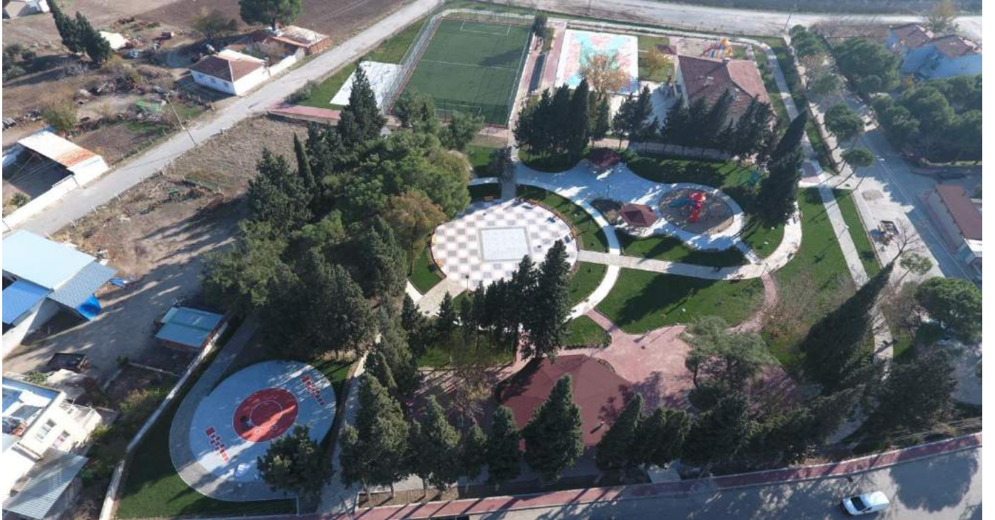
Nuriye Mahallesi Rekreasyon Alanı Çalışmalarının Tamamlanmasının Ardından Görünümü