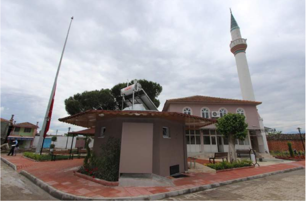
Adiloba Mahallesi'nde Bulunan Yeni Cami'nin Çalışma Sonrası Görünümü

İlçemiz Adiloba Mahallesi'nde bulunan Yeni Cami'de Belediyemizce yapılan yapılan çalışmalar çerçevesinde şadırvan yapılmış, caminin dış cephe boyanmış, yer döşemesi değiştirilmiş ve peyzaj çalışması gerçekleştirilerek yeni bir görünüm kazandırılmıştır.