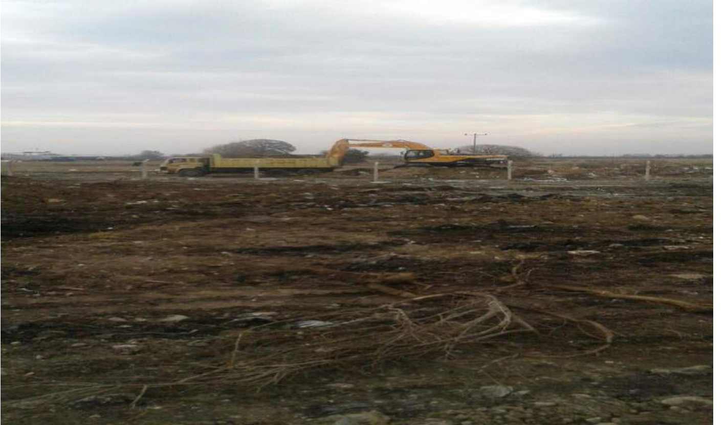
Paşaköy Mahallesi Depolama Sahası Temizlik Sırası Görünümü