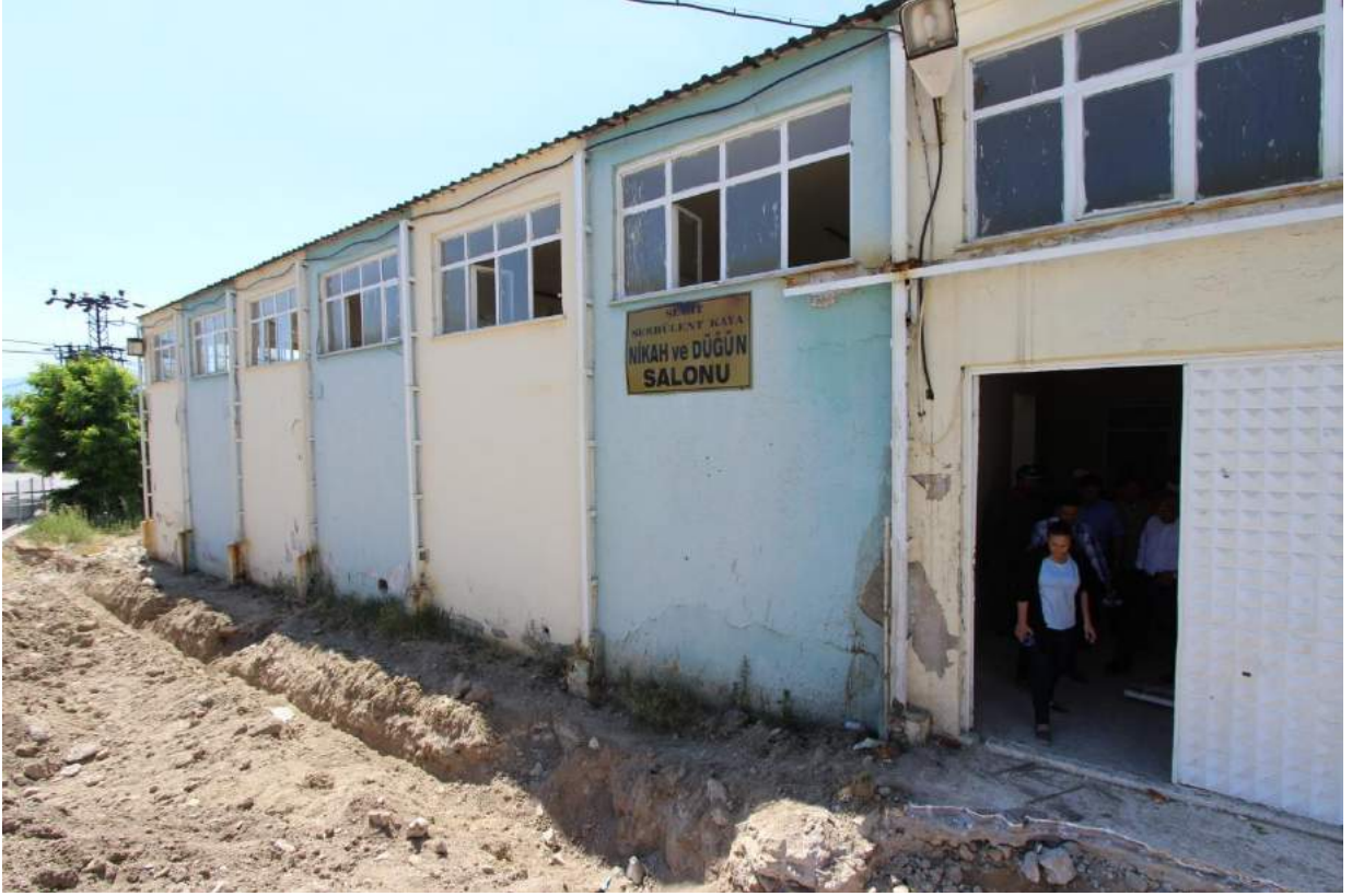
Gümülceli Mahallesi Eski Düğün Salonu

İlçemiz Gümülceli Mahallesi'nde 425 m2 kapalı alanı, 110 m2 terası birlikte 525 m2 toplam inşaat alanı ve 300 m2 açık düğün alanı, çocuk oyun grupları, yetişkin oturma alanları, çevre düzenlemeleri ile birlikte tamamlanmıştır.