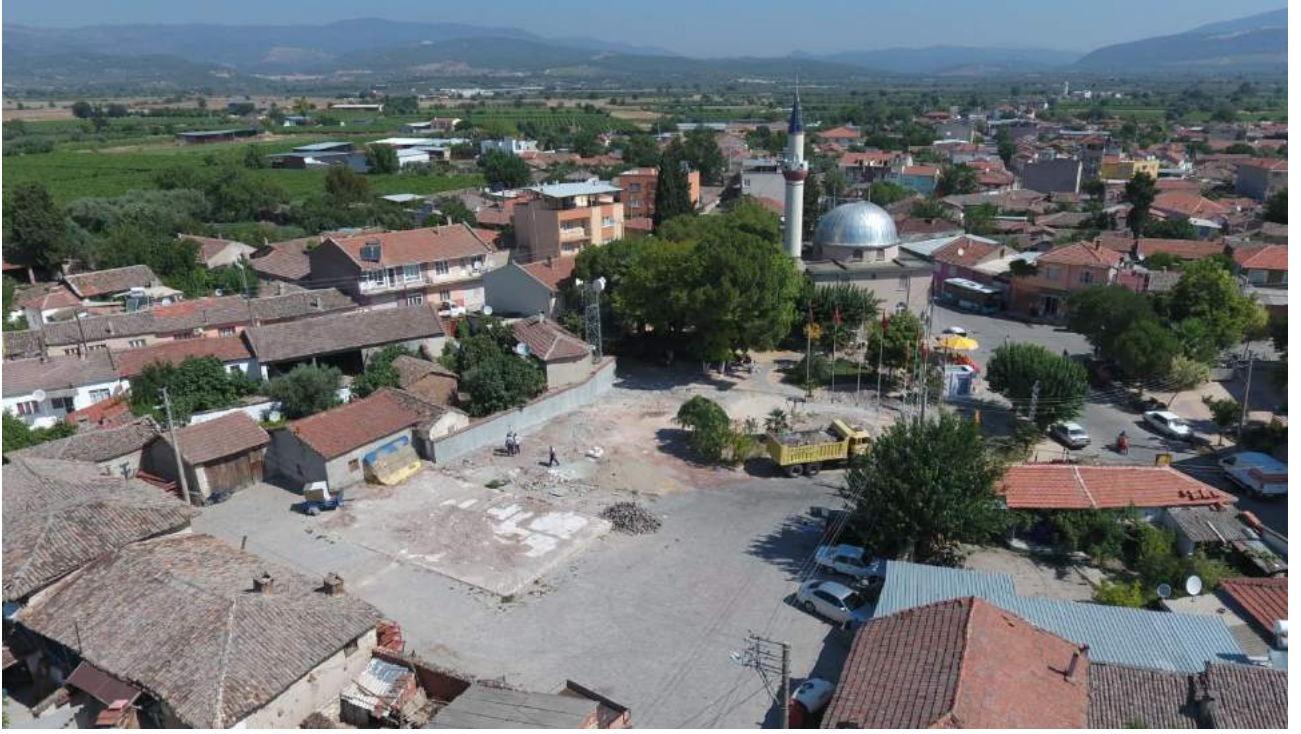
Paşaköy Mahallesi Meydan Düzenleme Çalışmaları Öncesi Eski Görünümü